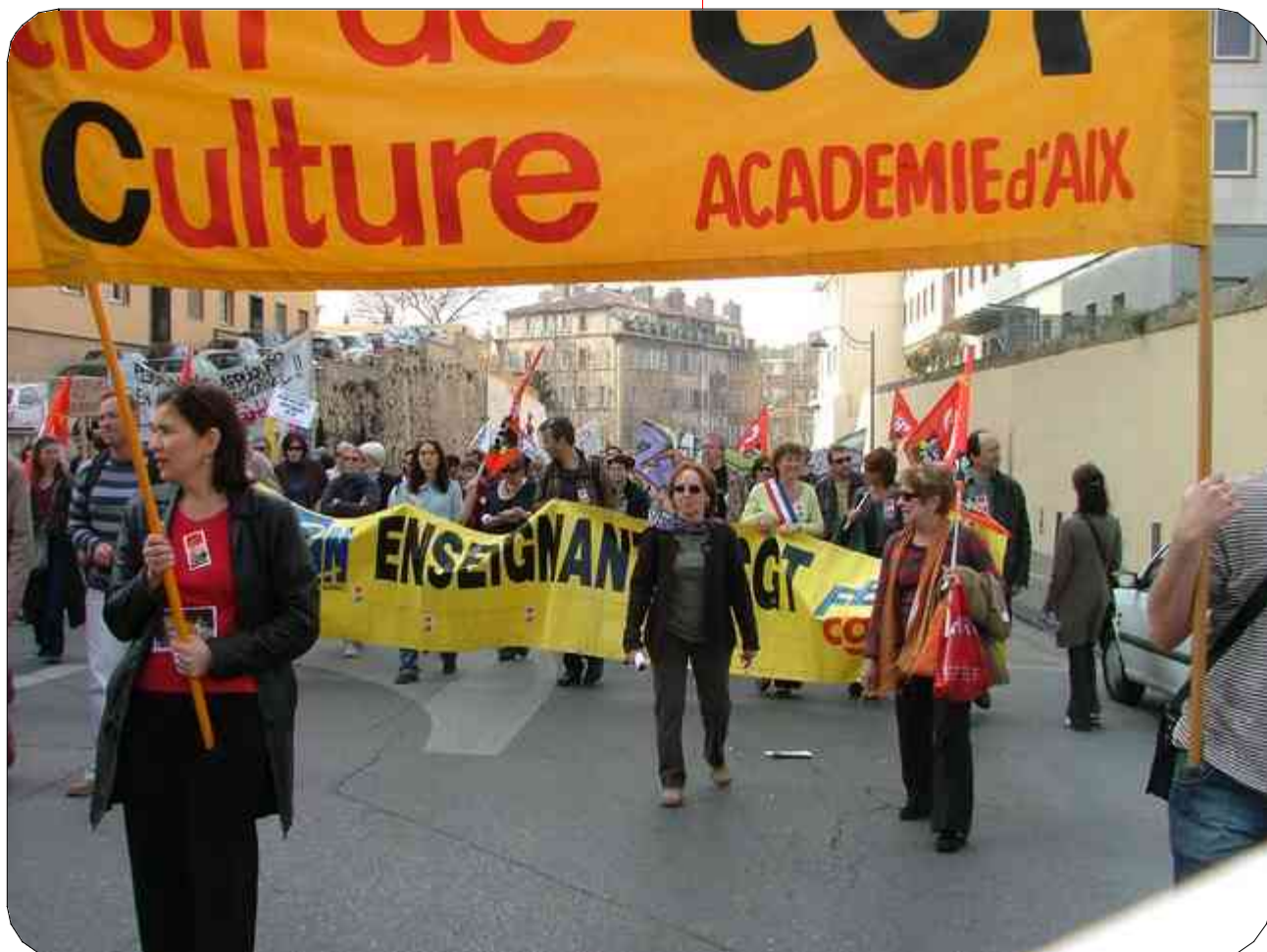
Manif du 19/03/09

Employés de vie scolaire ; Colloque de Uncevs (1) [...]